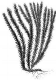
Плаун баранец РЕШУ ВПР

Заполните таблицу: запишите в неё основание, по которому были разделены организмы, общее название для каждой группы организмов и перечислите организмы, которые вы отнесли к этой группе.