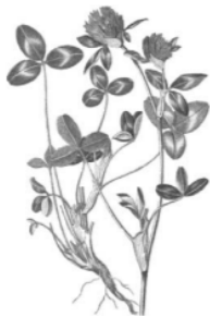
Г. _____ РЕШУ ВПР.РФ